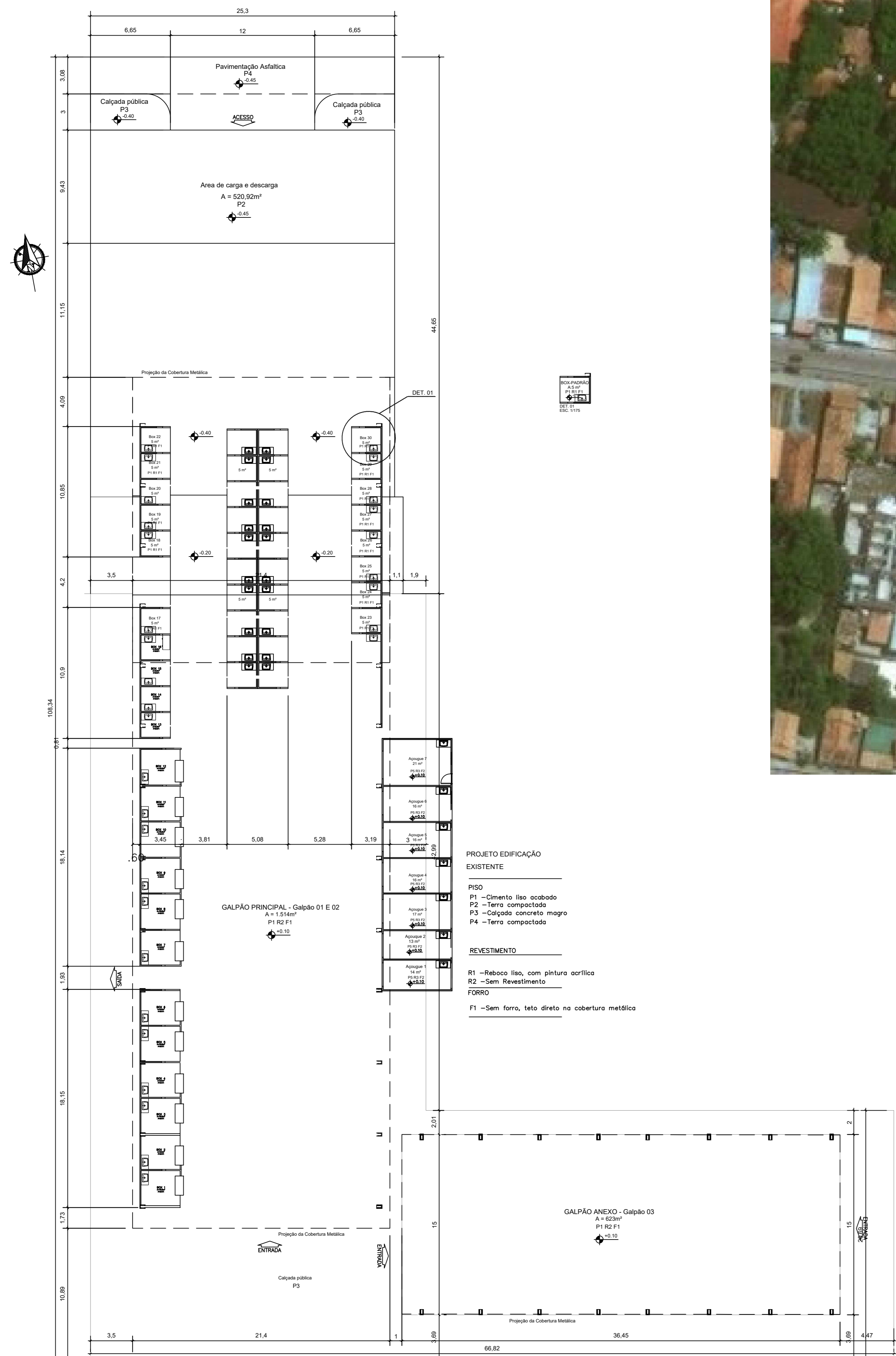
Planta Baixa - Levantamento arquitetônico galpão - Feira do produtor Escala 1:200