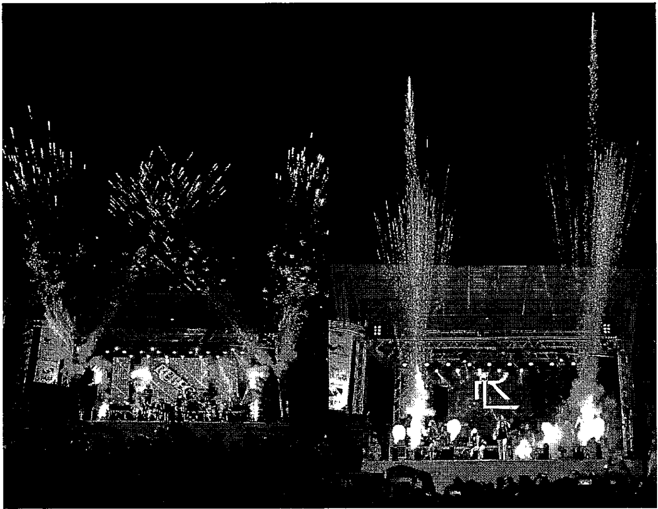
Fotos 1 Shows realizados no ano de 2022